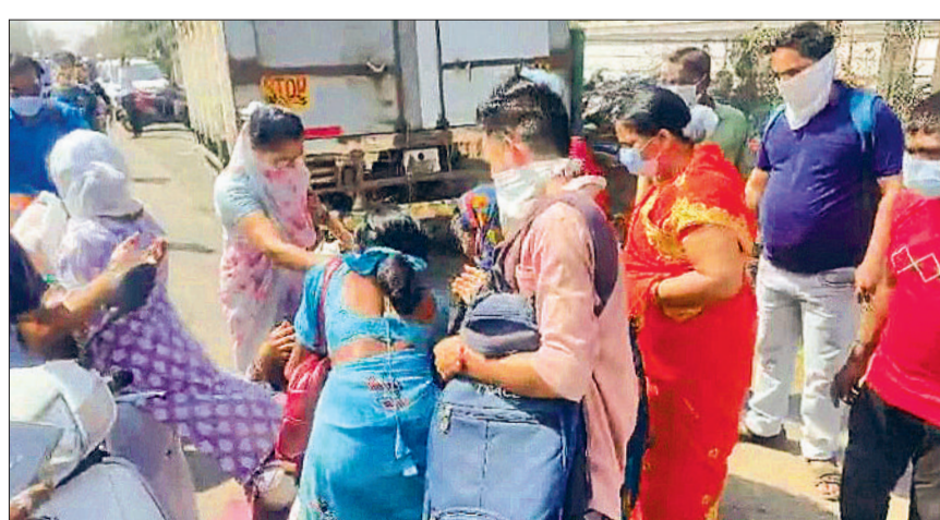
गैस लीक से सड़कों पर प्रभावित पीड़ित

महाराष्ट्र के पालघर जिले के एक औद्योगिक क्षेत्र में स्थित एक रासायनिक यूनिट से दोपहर को ओलियम (फ्लूइंग सल्फ्यूरिक एसिड) गैस का रिसाव हुआ। गैस लीक शुरू होते ही कंपनी के कर्मचारी जान बचाकर बाहर भागने लगे। आसपास की अन्य इकाइयों से करीब 2600 कामगारों को तत्काल सुरक्षित स्थान पर शिफ्ट किया गया। कई लोग सड़क पर ही बेहोश होते हुए दिखाई दिए, जिससे इलाके में दहशत फैल गई। अधिकारियों ने बताया कि एमआईडीसी डी-जोन क्षेत्र में स्थित भारीरिया केमिकल्स कंपनी (पूर्व में जॉनिथ केमिकल्स के नाम से जानी जाती थी) की इकाई से जहरीली गैस का रिसाव हुआ, जिसके चलते जिला प्रशासन और आपातकालीन सेवाओं ने तुरंत कार्रवाई की।